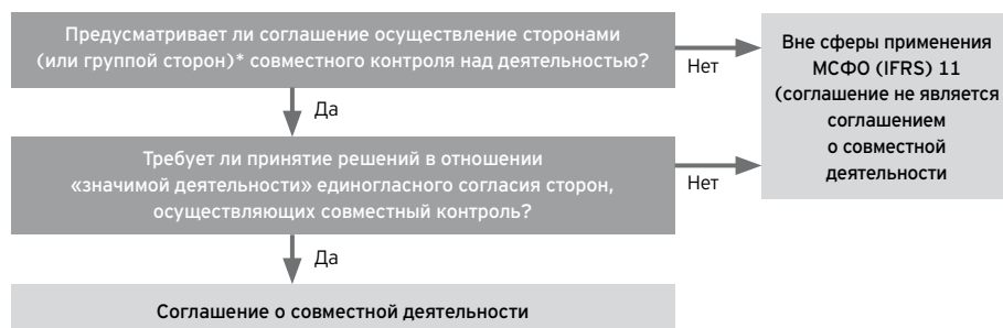
Диаграмма 2 - Является ли соглашение соглашением о совместной деятельности?