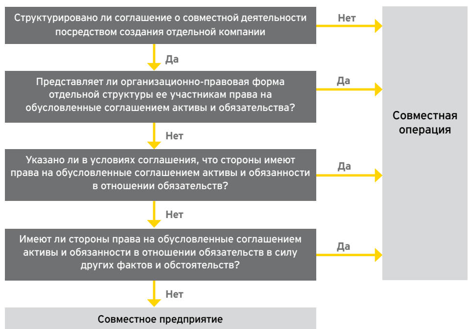
Диаграмма 4 - Классификация соглашения о совместной деятельности

Тем не менее, организационно-правовая форма соглашения о совместной деятельности по-прежнему очень важна. Как показано на Диаграмме 4, соглашение о совместной деятельности, которое не структурировано посредством создания отдельной компании (такой как партнерство, корпорация или иная финансовая структура) классифицируется в качестве совместной операции. Однако при наличии отдельной компании соглашение о совместной деятельности не обязательно классифицируется в качестве совместного предприятия. Классификация зависит от условий самого соглашения о совместной деятельности, а также от прочих фактов и обстоятельств.