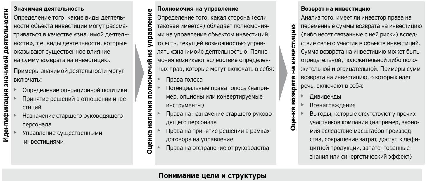
Диаграмма 1: Анализ наличия контроля

Инвестор контролирует объект инвестиций, если он имеет права на переменную сумму возврата на инвестицию (либо несет связанные с ней риски), обусловленные его участием в объекте инвестиций, и обладает возможностью влиять на данную сумму возврата вследствие своих полномочий в отношении объекта инвестиций