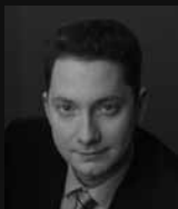
Борис Ложкін президент, «United Media Holding», переможець конкурсу «Підприємець року 2008» в Україні