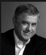
Анатолій Кирилович Кінах голова журі, президент, «Український союз промисловців та підприємців»