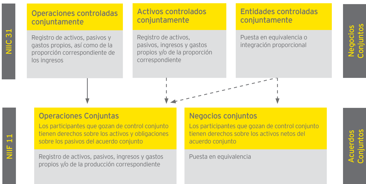
Diagrama II - Tratamiento contable

Los activos controlados conjuntamente y las operaciones controladas conjuntamente (según se definen en la NIC 31) reciben la denominación de operaciones conjuntas en la NIIF 11 y su contabilización será equivalente a aquella indicada en la NIC 31. El inversor que ostenta control conjunto seguirá reconociendo sus activos, pasivos, ingresos y gastos, y/o su parte correspondiente de los mismos, si procede.