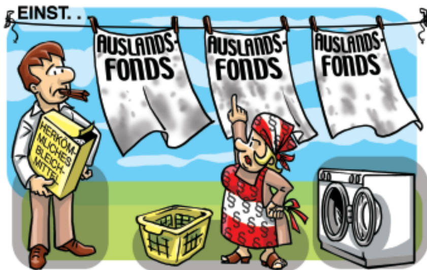
Illustration: Markus Murrasits

Drei Monate nach der Einführung des neuen Meldesystems für ausländische Fonds zieht GEWINN eine erste Bilanz und kommt zu einem für Anleger erfreulichen Ergebnis.