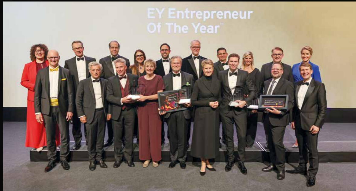
Die Moderatorin, die Laudator:innen und die Gewinner:innen des EY Entrepreneur Of The Year 2025

Die Verleihung der Awards EY Entrepreneur Of The Year findet am 5. November 2026 in der Wappenhalle in München statt. An diesem Abend erhalten die Gewinner:innen der vier Kategorien FAMILIENUNTERNEHMEN, INNOVATION, NACHHALTIGKEIT und JUNGE UNTERNEHMEN die Awards. Ebenso werden der Ehrenpreis für außergewöhnliches unternehmerisches und gesellschaftliches Engagement sowie der Audience Award verliehen. Zum Abschluss wird zudem aus den Sieger:innen der vier Kategorien der:die Nominee für den EY World Entrepreneur Of The Year bekannt gegeben.