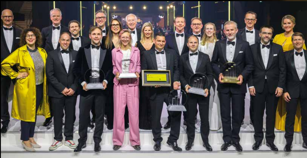
Die Moderatorin, die Laudator:innen und die Gewinner:innen des EY Entrepreneur Of The Year 2024

Die Verleihung der Awards EY Entrepreneur Of The Year 2025 findet am 6. November 2025 in der Wappenhalle in München statt. An diesem Abend erhalten die Gewinner:innen der vier Kategorien Familienunternehmen, Innovation, Nachhaltigkeit und Junge Unternehmen die Awards. Ebenso werden der Ehrenpreis für außergewöhnliches unternehmerisches und gesellschaftliches Engagement sowie der Audience Award verliehen. Zum Abschluss wird zudem aus den Sieger:innen der vier Kategorien der:die Nominee für den EY World Entrepreneur Of The Year bekannt gegeben.