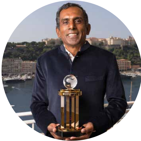
EY World Entrepreneur Of The Year™ Class of 2024, India