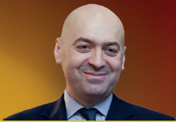
Rasim Əliyev Geothermal Agro Aqrar sahədə dayanıqlı inkişaf