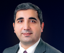
Tehran Əliyev VITAM Azərbaycan və hüdudlarından kənarında