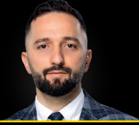
Baba Ağayev Vizam.az İnnovasiya