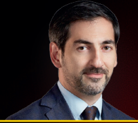
Vüqar Cəfərov YİGİM Ödəniş Sistemi Ən yaxşı müştəri həlli