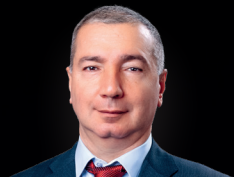
Elçin Əliyev Regional Hospital Regional inkişaf