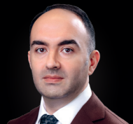
Bəhrüz Rüstəmov Upsystems İnnovasiya