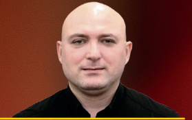
Emil Leznik Landau məktəbi Sosial təsir