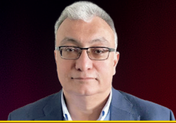
Fərid Axundov Chabiant Aqrar sahədə davamlılıq və regional inkişaf