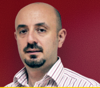
Fərid İsmayılzadə GoldenPay İnnovasiyalar