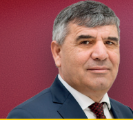
Əliyər Əliyev Woodpecker Regional inkişaf