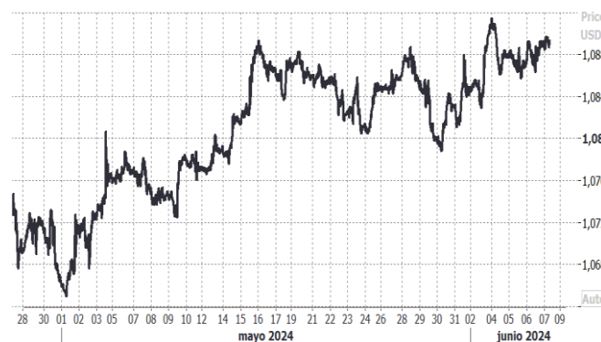
USD/EUR, evolución semanal: Reuters

Por otro lado, el yen japonés continúa cotizando niveles muy cercanos a los mínimos de más de 34 años registrados a finales del mes de abril. La divisa asiática acumula un 2024 complejo, en donde la consistente pérdida de valor llevó incluso a provocar una intervención en su mercado, con el objetivo de reducir la pérdida de competitividad. El Banco de Japón se reunirá la próxima semana, no se anticipan nuevas subidas en el tipo de interés oficial.