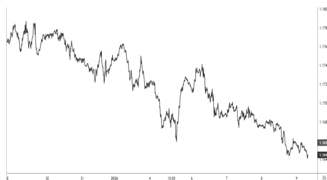
USD/EUR, evolución semanal

En paralelo, el USD también se benefició de la vulnerabilidad que muestra el EUR en los mercados ante la frialdad de sus datos económicos y la falta de alternativas de gobierno que está mostrando ante los ataques norteamericanos en relación con una posible ocupación de Groenlandia.