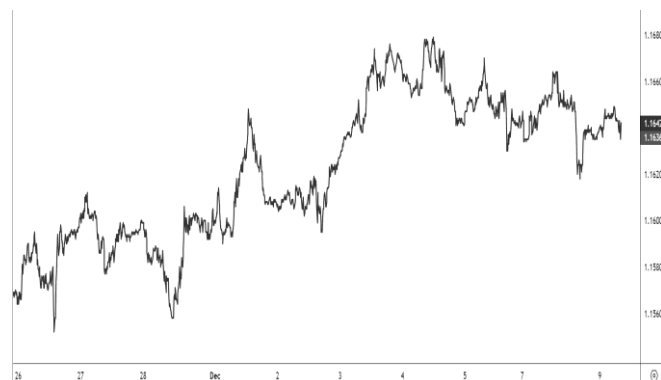
USD/EUR, evolución semanal

Dentro de la tranquilidad del mercado, destaca la cesión del yen, llegando nuevamente al máximo histórico del euro en 182 JPY/EUR al inicio de la sesión europea. Las declaraciones del gobernador del Banco de Japón, Kazuo Ueda, en las que ve una subida de los tipos de interés de largo plazo algo rápida sería un signo de menor preocupación por el debilitamiento del yen, o al menos una menor disposición a subir los tipos de interés para evitar una mayor depreciación. La rentabilidad del bono japonés a 10 años ha alcanzado máximo de los últimos 18 años ante la preocupación sobre la evolución de las finanzas públicas.