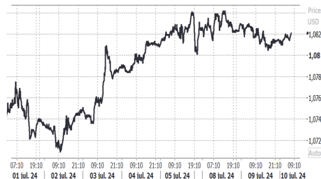
USD/EUR, evolución semanal

Por otro lado, el yuan chino acumula importantes cesiones en su cambio frente al dólar, cotizando mínimos no vistos en más de ocho meses. La divisa china se ha visto penalizada ante la publicación del dato de inflación para el mes de junio que, en su lectura anualizada se situaba en niveles del 0,2%, muy lejos de las estimaciones iniciales que descontaban una cifra del 0,3%. Los moderados registros macroeconómicos del gigante asiático han provocado que, en lo que va de 2024, el yuan haya acumulado una pérdida de valor de más del 2% en su cambio frente al dólar.