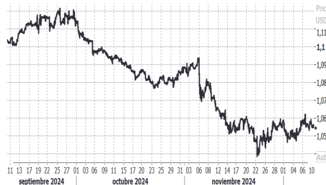
USD/EUR, evolución semanal

La GBP cotiza frente al EUR máximos no vistos desde marzo 2022 en 0,8270. La incertidumbre y volatilidad que hay en los mercados de cambio favorece la demanda de esta divisa que mantiene los tipos de interés en el 4,75%. Reunión del BOE 19/12.