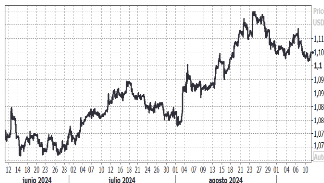
USD/EUR, evolución semanal: Reuters

El peso mexicano continúa depreciándose frente al USD encontrándose en niveles mínimos de finales de 2022 (actualmente cotiza en 19,91 pesos mexicanos por dólar americano). Por su parte, el peso colombiano alcanza su nivel más bajo en 10 meses frente al USD cotizando en 4.238 COP/USD a la expectativa de un recorte de tipos de 75 p.b. en su próxima reunión a finales de septiembre tras el recorte de 50 p.b. en sus últimas 4 reuniones hasta el nivel actual de 10,75%