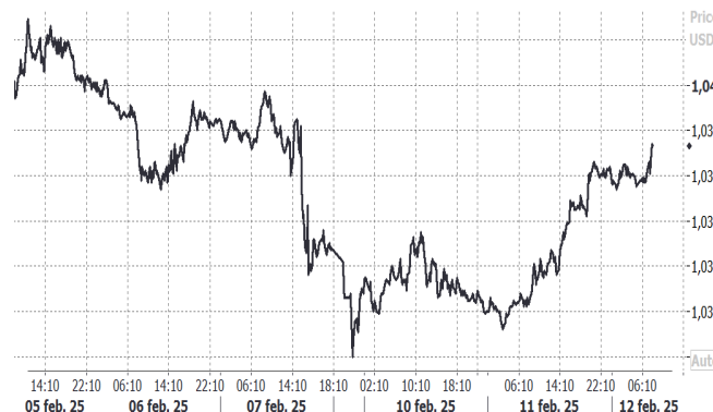
USD/EUR, evolución semanal