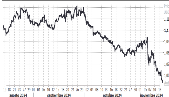
USD/EUR, evolución semanal

El dólar americano continúa su tendencia alcista cotizando en máximos de un año frente al EUR en 1,0594, la dinámica del mercado sigue siendo la misma que en jornadas precedentes después de la elección del presidente de Estados Unidos, Donald Trump. La siguiente referencia técnica se sitúa en 1,0470 USD/EUR, con un nivel de sobrecompra de USD medido por el RSI 67%. No obstante, el billete verde retrocedía parte del terreno ganado después de la publicación del dato de inflación que repuntaba en línea con lo esperado. El índice DXY cotizaba ligeramente a la baja en 105,88. El yen japonés continúa retrocediendo y cotiza en mínimos de tres meses frente al USD en 155 yenes por dólar, cerca de la barrera de los 160. Algunos miembros del gobierno japonés han mostrado su preocupación por una divisa débil y una volatilidad elevada. El mercado estará atento a una posible intervención en el mercado de divisas por parte del gobierno japonés. Por último, la libra se encuentra cerca de niveles mínimos de tres meses frente al dólar en 1,2795 después de la publicación de una moderación de la inflación inglesa y el crecimiento de los salarios más débil en los últimos dos años. El BoE recortó los tipos de interés la semana pasada y el mercado solo ve una probabilidad de un nuevo recorte de tipos en su próxima reunión en diciembre de un 15%