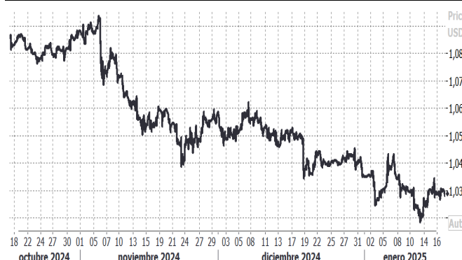
USD/EUR, evolución semanal