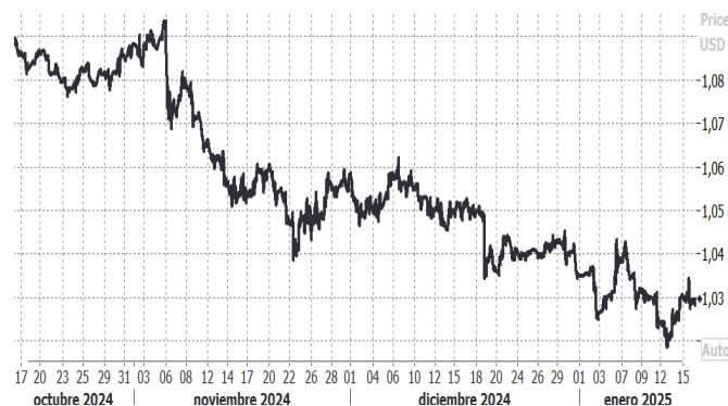
USD/EUR, evolución semanal

El dólar estadounidense retrocede posición después de la publicación del dato de inflación del país, en la que la inflación general se aceleró en diciembre tal y como se esperaba, mientras que la inflación subyacente mostro desaceleración. El índice DXY que mide el comportamiento del USD frente a las principales divisas se deja más de un 0,4% hasta los 108,7. Por otra parte, la libra esterlina se mantiene estable frente al USD y EUR tras la publicación de la inflación en Reino Unido, menor a la esperada. Las expectativas de los analistas de un recorte de los tipos de interés (25 punto básicos) por parte del BoE ha incrementado de un 60% a un 80% tras la publicación del dato de inflación. La rupia india recupera posiciones frente al US. El gobernador del Banco de la Reserva India (RBI) declaraba estar dispuesto a permitir una mayor volatilidad en su divisa. En este sentido, los analistas atribuyen este cambio en la volatilidad de la rupia a que el RBI está cambiando su estrategia en torno a la protección de su divisa empleando más los tipos de interés que el uso de sus reservas en divisa. Por último, el peso mexicano recupera posiciones y cotiza con ganancias frente al USD por tercer día consecutivo en un entorno de incertidumbre sobre las posibles medidas impuestas a Donald Trump al país mexicano.