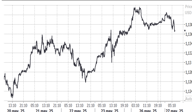
USD/EUR, evolución semanal

A la espera de novedades, los analistas técnicos siguen anticipando la posibilidad de una corrección temporal de carácter apreciatorio que permita volver a cotizar al USD frente al EUR en el rango 1,0700 – 1,1000 USD/EUR. Esta corrección sería natural tras la cesión ya registrada en el periodo febrero – abril de este año desde 1,0142 hasta 1,1573. Esta semana conoceremos datos de inflación y PIB tanto de la Zona Euro como de EEUU.