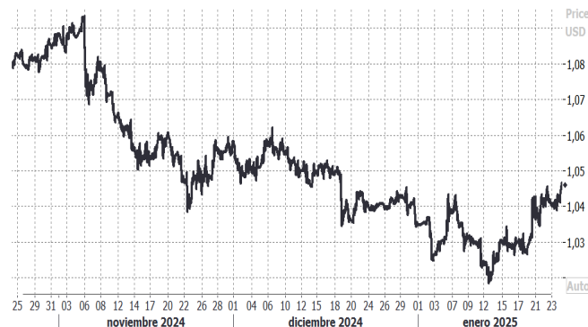
USD/EUR, evolución semanal

Por su parte, la libra esterlina recuperó terreno, avanzando un 1,04% a $1,2479 y perfilándose para un aumento semanal de 2,58%, tras tres semanas consecutivas de pérdidas.