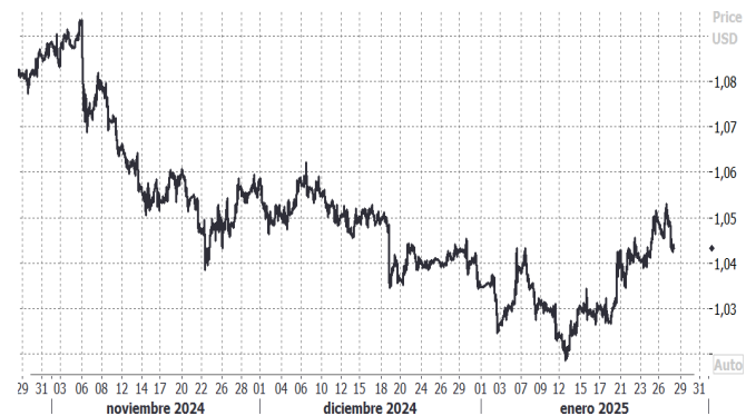
USD/EUR, evolución semanal

La libra esterlina, en tanto, retrocedió un 0,43% frente al dólar, cerrando la jornada en $1,2447. Este desempeño refleja la cautela de los mercados respecto a la política fiscal británica y el impacto de las tensiones comerciales internacionales.