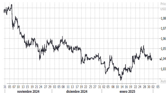
USD/EUR, evolución semanal: Reuters

En Asia, el yen se perfilaba para su mejor inicio de año desde 2018, impulsado por la expectativa de que el Banco de Japón (BOJ) continúe con su política de ajuste monetario en un contexto en el que otros bancos centrales buscan recortar tipos. El dólar retrocedió un 0,4% frente a la moneda japonesa, situándose en 154,61 yenes, mientras que el euro perdió un porcentaje similar, cayendo a 161,10 yenes. Por su parte, el dólar canadiense se mantuvo cerca de su nivel más bajo en cinco años, cotizando en 1,4477 por dólar estadounidense, mientras que el peso mexicano se ubicó en 20,6643 por dólar.