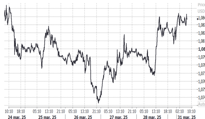
USD/EUR, evolución semanal

El dólar canadiense cedió un 0,1% hasta 1,4315 por dólar estadounidense, aunque acumuló una ganancia semanal del 0,2%, marcando su cuarta semana consecutiva al alza en medio de apuestas de que la economía estadounidense sufrirá los efectos de la creciente guerra comercial global. En Asia, el yuan chino subió ligeramente desde un mínimo de tres semanas, a la espera de mayor claridad sobre los aranceles recíprocos de EE. UU. contra China, mientras que el yen japonés se fortaleció un 0,46% hasta 149,145 por dólar, tras haber avanzado hasta un 0,74% en la última sesión.