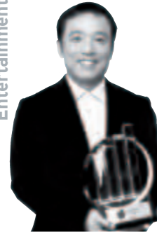
김택진 엔씨소프트 대표이사 사장 Taek-Jin Kim CEO of NCSOFT