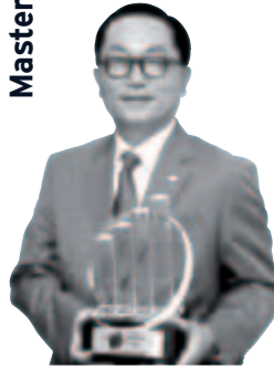
박현주 미래에셋 회장 Hyeon Joo Park Chairman of Mirae Asset