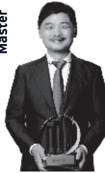
김범수 카카오 의장 Beom Su Kim Chairman of Kakao Corp.