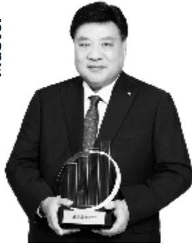
서정진 셀트리온그룹 회장 JungJin SEO Chairman of Celltrion Group