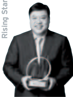
서정진 셀트리온 회장 JungJin SEO Chairman of Celltrion