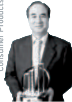
윤석금 웅진그룹 회장 Seok-Keum Yoon Chairman of Woongjin Group