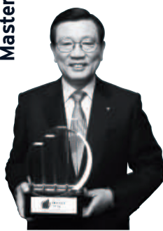
박삼구 금호아시아나그룹 회장 Sam-Koo Park Chairman & CEO of Kumho Asiana Group