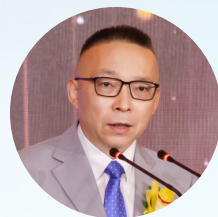
焦捷 独立评委会主席 清华大学五道口金融学院院长

生态环境部正在全力推进“十五五”规划工作，加强科技赋能实现提质增效是其中的一项重要抓手。我很高兴看到本届活动以“数智绿动 创领新程”为主线，将上市公司以数智化技术创新，融合可持续发展的优秀实践进行了系统化的梳理和提炼，并加以表彰，为更多企业提供启示，推动它们在实践中找准定位，创新发展。