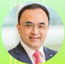
陈凯 安永中国主席 大中华区首席执行官