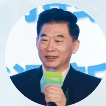
王思强 中国电力建设企业 协会会长