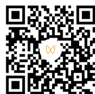
扫码观看论坛 精彩回顾视频

众多政府领导、行业先锋、思想领袖、学术专家及上市公司代表齐聚一堂，以“数智绿动 创领新程”为主题，立足国家重大战略部署和当前人工智能（AI）技术发展前沿，深入探讨数智化技术如何推动产业升级，助力上市公司高效提升ESG表现。