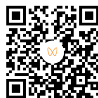
扫码观看颁奖典礼 精彩回顾视频