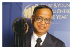
Narayana Murthy 2003 India Infosys Technologies Limited