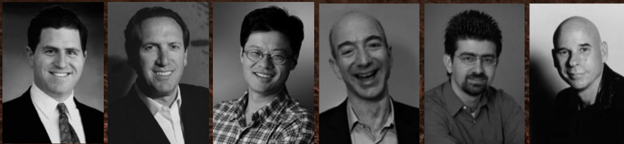
Michael Dell, Dell Howard Schultz, Starbucks Jerry Yang, Yahoo! Jeff Bezos, Amazon.com Pierre Omidyar, eBay Guy Laliberté, Cirque du Soleil

2005年，臺灣開始舉辦《安永企業家獎》選拔，期許表彰創造並帶領企業持續成長及革新的卓越企業家，以推崇他們的遠見、領袖風範和傑出成就來啟示社會。藉由參與這個具國際聲望的獎項，安永將臺灣優秀的企業家提升至世界級地位，讓他們與來自全球的成功企業家一起在國際舞臺上發光發熱。