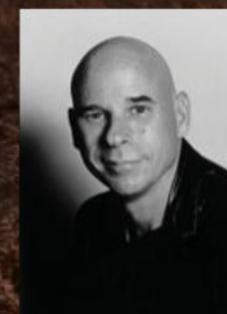
Jensen Huang, NVIDIA Michael Dell, Dell Howard Schultz, Starbucks Jerry Yang, Yahoo! Jeff Bezos, Amazon.com Pierre Omidyar, eBay Guy Laliberté, Cirque du Soleil