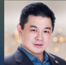
許逸德 總經理 華城電機股份有限公司

梁又文 總經理為2025《安永企業家獎》年度大獎得主。梁又文為志聖工業執行長暨總經理，均豪精密副董事長兼執行長，均華精密董事長兼執行長。他推動「成人之美」組織哲學與「T型策略」，讓公司切入台積電等半導體大廠先進封裝供應鏈，更促成G2C+聯盟成立，創造一站式服務的設備商新模式，帶領聯盟持續突破。梁又文總經理重視永續實踐與社會參與，帶領企業推進ESG藍圖，從碳盤查、供應鏈減碳到文化創生，積極展現企業的公共性。他推動員工心理安全與家庭友善制度，啟動跨世代共學與多元輪調機制，實踐企業的包容力與續航力。作為產學合作推手，他在清華大學、臺灣大學、臺灣科技大學、逢甲大學等多校開講，將志聖的轉型經驗分享於青年與產業之間。