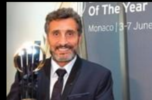
Mohed Altrad 2015 France Altrad