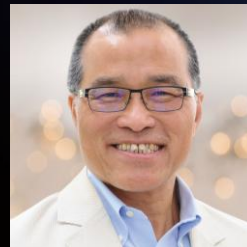
葉匡時 講座教授 中華大學

薛富盛博士曾任環境部部長、國立中興大學校長、臺灣國立大學系統總校長、財團法人大學入學考試中心基金會董事長、漢翔航空工業(股)公司董事、財團法人工業技術研究院監事、臺灣產業科技推動協會理事長、中華民國農業教育學會理事長。累計發表SCI期刊論文216篇，專書及專書論文7本，發明專利16件，曾獲得許多國內外學術獎項，包含英國國際工程與科技學會、英國材料與礦冶學會、澳洲能源學會會士及美國康乃爾大學傑出校友等榮譽。