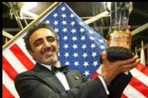
Hamdi Ulukaya 2013 United States Chobani, Inc.